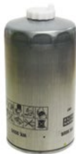
MF WK950/6 | 195 Kč