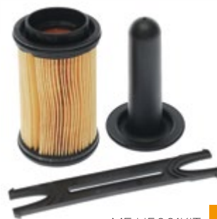
MF U5001KIT | 585 Kč

OE kódy: 1927474 5801667204 7421574991 21496419