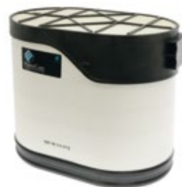
DON P608677 | 1 450 Kč

OE kódy: A0040946304 N102191 334R1768 T340571 10873389