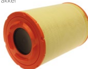
FILTRON® FI AM455/6 | 650 Kč