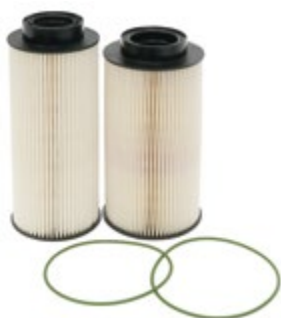
DON X770914 | 459 Kč