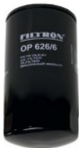
FILTRON® FI OP626/6 | 142 Kč

OE kódy: 1399494 2992242 402-040222 2164919