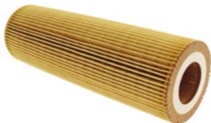
XT E123H01D194 | 250 Kč