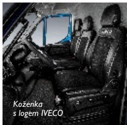
Koženka s logem IVECO