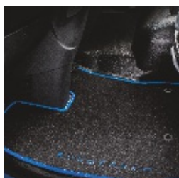
Textilní koberečky 783 Kč