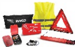
Nouzová sada a lékárnička 1.140 Kč