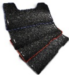
Textilní koberečky 846 Kč