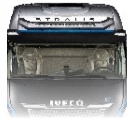
Světelná rampa Stralis 45.873 Kč