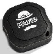
GPS lokátor 3.857 Kč