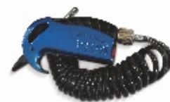
Vhodné i pro STRALIS X